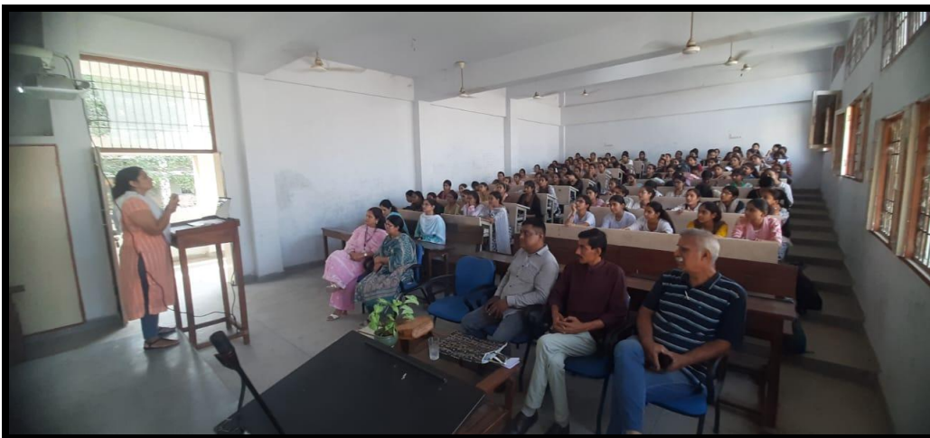
Swikar Samaj Kalyan Samiti Delivers Insightful Extension Lecture to students on Anti- Tobacco Awareness