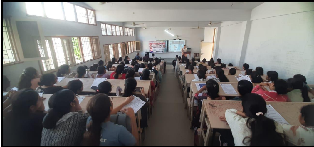
Students attending Extension lecture on Drug Awareness