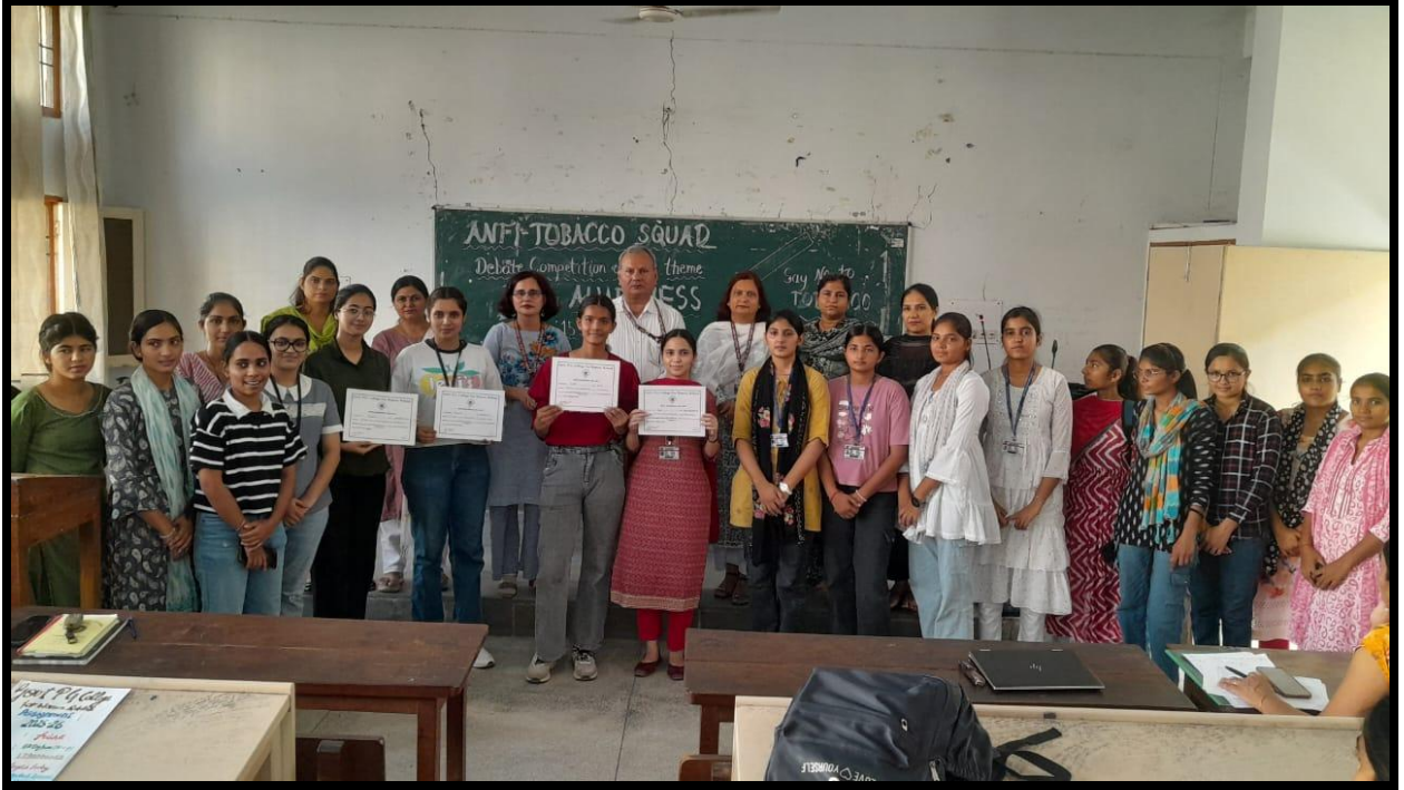
Students Showcase Oratory skills in Anti Tobacco Debate Competition