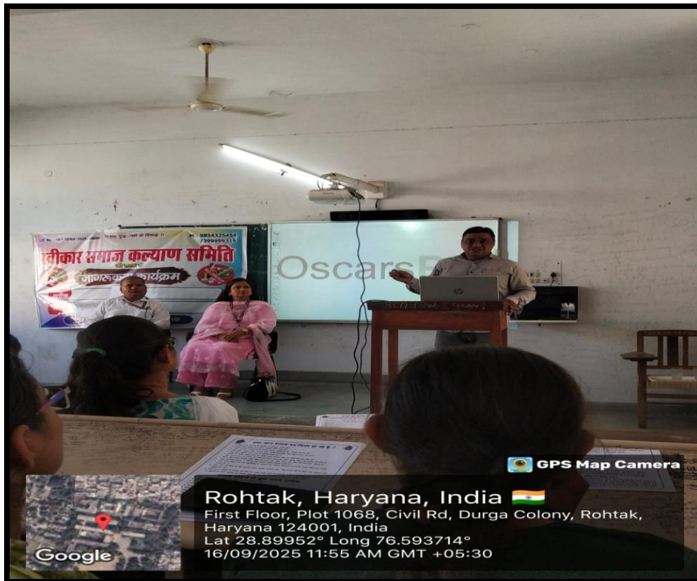
Swikar Samaj Kalyan Samiti Delivers Insighful Extension Lecture on Anti- Tobacco Awareness